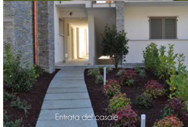
Entrata del casale