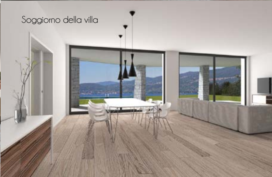
Soggiorno della villa