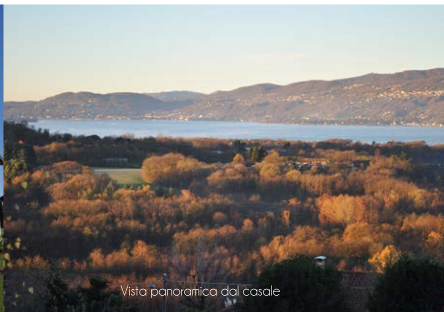
Vista panoramica dal casale