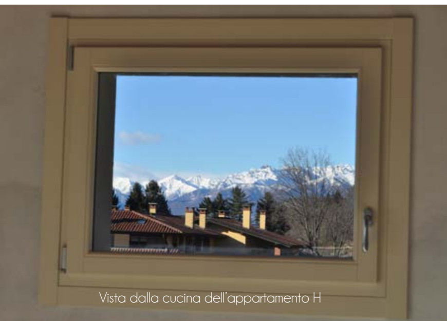
Vista dalla cucina dell'appartamento H

La fantastica posizione panoramica e la posizione soleggiata e silenziosa del complesso immobiliare Le Magnolie offre la possibilità di risiedere in un contesto privilegiato od utilizzare una bellissima seconda casa con tutti i comfort, ma anche di sfruttare un'ottima possibilità di investimento acquistando un appartamento che in base alla località ed alle caratteristiche costruttive non subirà le svalutature di mercato di altri contesti e sarà ricercato da coloro i quali vorranno locare un immobile di pregio con vista panoramica. Offriamo la consulenza per il finanziamento a tassi vantaggiosi. La normativa italiana e la legge di stabilità del 2016, prevede rilevanti vantaggi fiscali per gli acquirenti di immobili in classe A, sia ai fini della propria residenza, sia per immobili da locare.