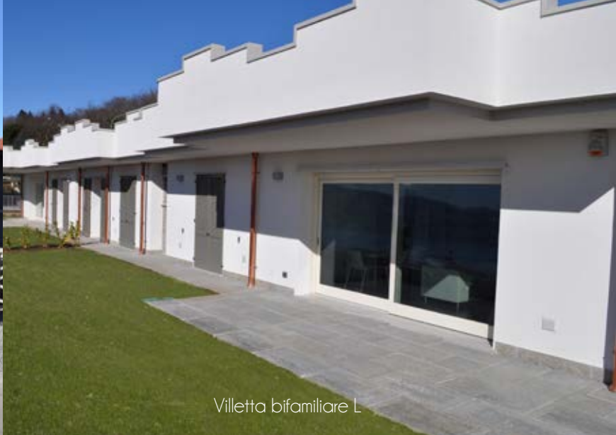
Villetta bifamiliare L