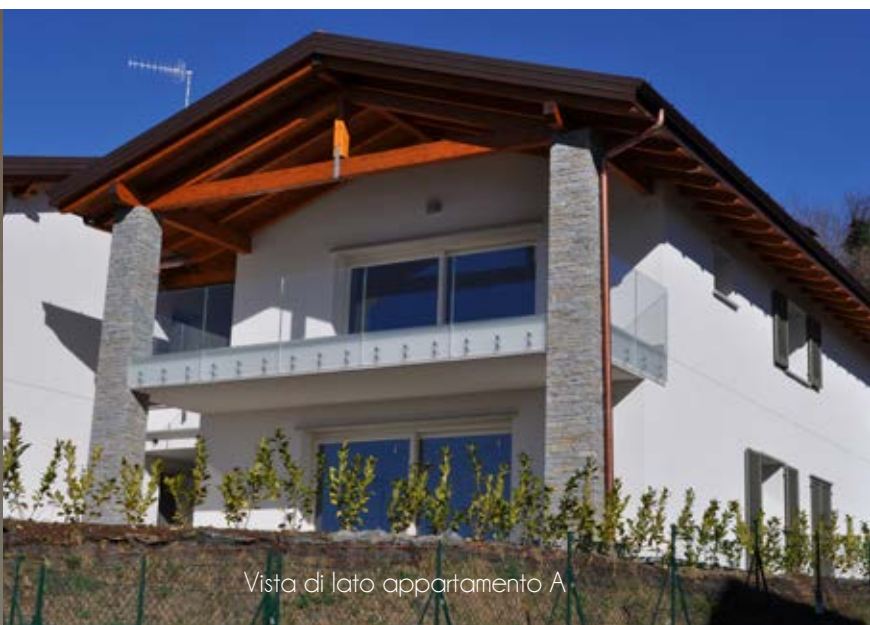
Vista di lato appartamento A