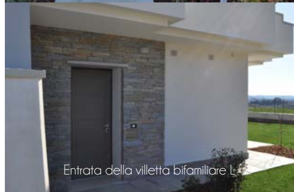
Entrata della villetta bifamiliare