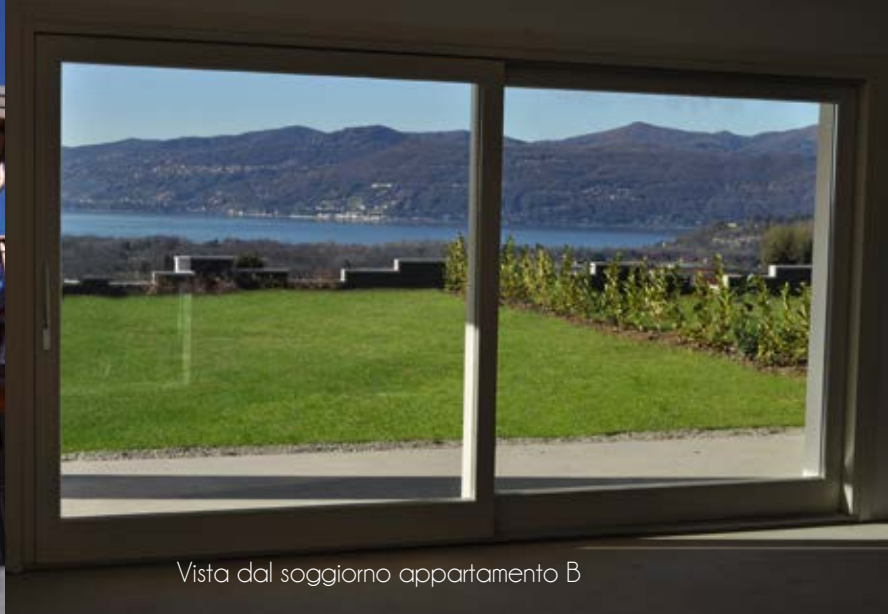
Vista dal soggiorno appartamento B