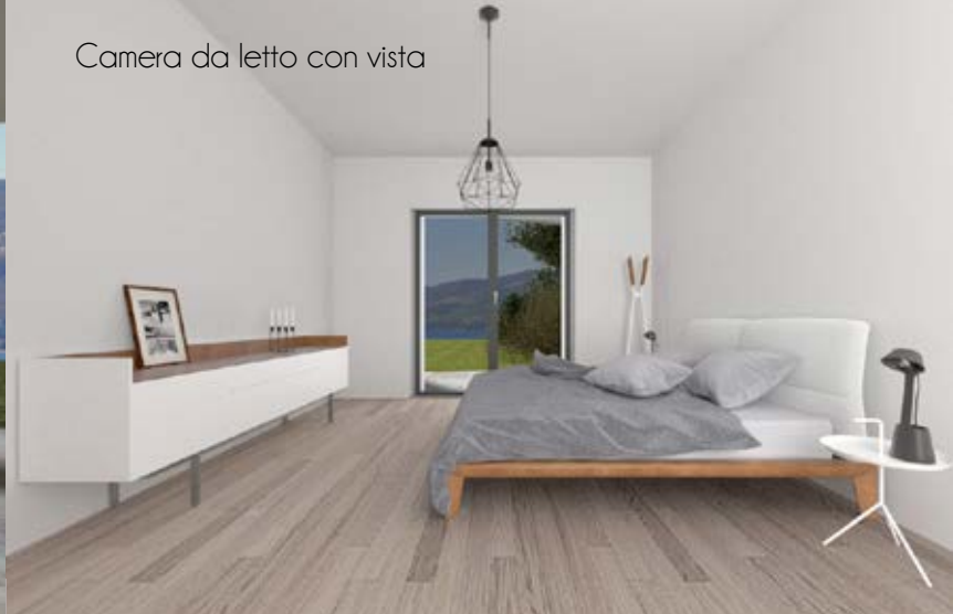
Camera da letto con vista