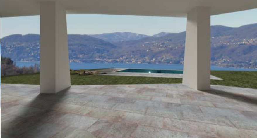
Vista dal portico della villa