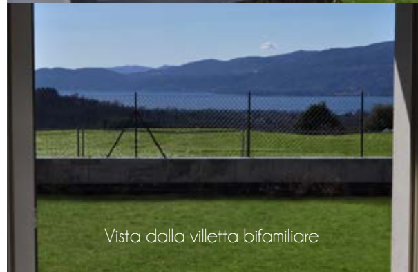
Vista dalla villetta bifamiliare