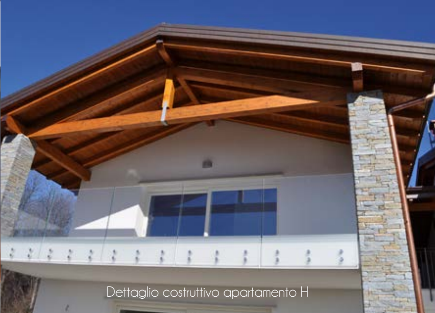
Dettaglio costruttivo appartamento H