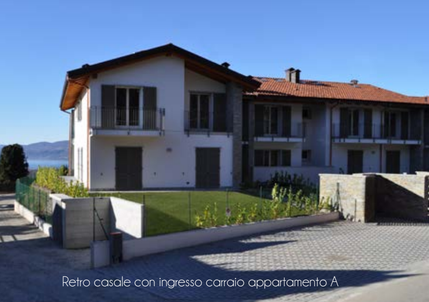
Retro casale con ingresso carraio appartamento A